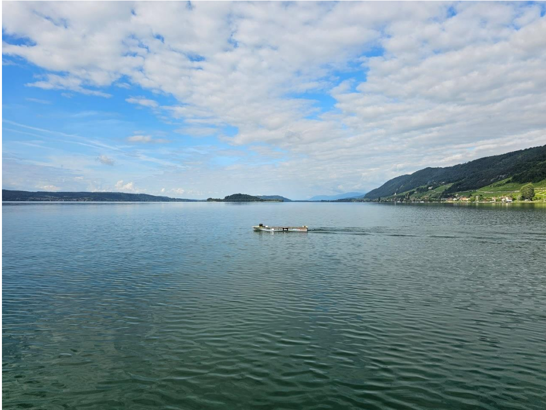
Illustration 3 : WALL-B en pleine action.