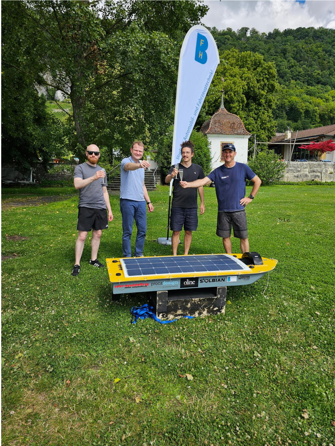
Illustration 2 : L'équipe du projet après le retour triomphal de WALL-B.